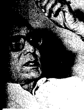
क अभिव्यक्ति इस वृद्धावस्था में भी