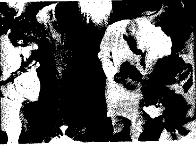
पटना मिटी गोलीकांड में शहीद हुए एक निहत्थे लोक-सेवक की लाश के पास लोकनायक जे. पी. का

छात्र जन संघर्ष समिति राजभवन, राजवंशी नगर, शास्त्रीनगर, विद्युत बोर्ड कॉलोनी पटना