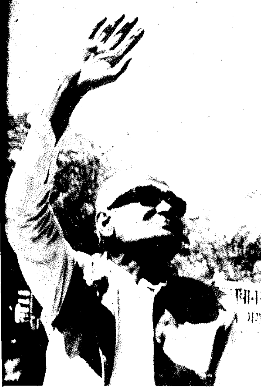
विहार विधान सभा का घेराव कराने जाते हुए जयप्रकाश

बापू ने कहा—'तुम कांग्रेस के अध्यक्ष बनो।'