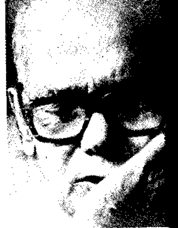
पटना में पुलिस की लाठी के पीछे की चीम सहता हुआ वृद्ध जे. पी. का