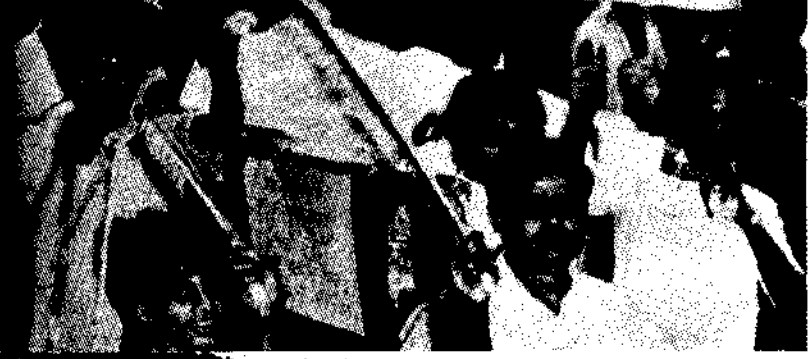
लोकनायक की उत्प्रेरणा का परिणाम : लोककान्ति की लहर

छात्र जन संघर्ष समिति राजभवन, राजवंशी नगर, शास्त्रीनगर, विद्युत बोर्ड कॉलोनी पटना