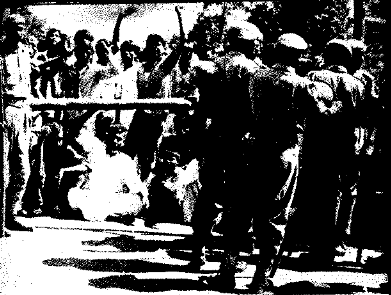
सचिवालय के दक्षिणी द्वार पर सत्य का आग्रह करने जनता

“रुक जाओ ! सचिवालय में आज कोई काम नहीं होगा !”—सचिवालय के मुख्य द्वार को रोके खड़े सत्याग्रही